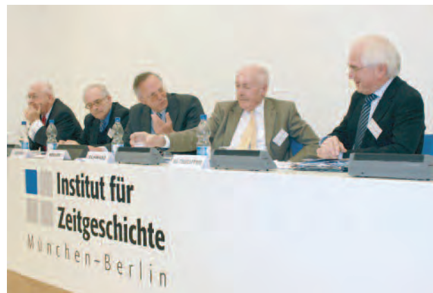
Podiumsdiskussion während der KSZE-Konferenz

Im Mittelpunkt des durch Mittel aus dem Pakt für Forschung und Innovation geförderten Kooperationsprojekts steht die Bedeutung, die der KSZE-Prozess für die Entstehung des mit der Charta von Paris 1990 geschaffenen »neuen Europa« spielte. Deshalb liegt der Schwerpunkt der Forschungen auf dem Zeitraum nach Unterzeichnung der Schlussakte von Helsinki am 1. August 1975, in dem die Teilnehmerstaaten daran gingen, die getroffenen Vereinbarungen im Kontext wachsender internationaler Spannungen zu verwirklichen.