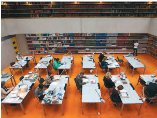
Lesesaal von Archiv und Bibliothek

Als größere Maßnahme für die kommenden Jahre wurde mit den Planungen für die Umstellung auf ein elektronisches Ausleihsystem begonnen. Bislang findet die Ausleihverbuchung in klassischer Manier mit manuell auszufüllenden Leihscheinen statt – mit der elektronischen Ausleihe könnte der Komfort durch Online-Bestellung sowie Selbstverbuchung für die institutsinterne Benutzung deutlich erhöht und damit die Attraktivität der Bibliothek als Forschungsort weiter gesteigert werden. Die Finanzierung einer solchen aufwendigen Systemumstellung ist jedoch noch völlig offen.