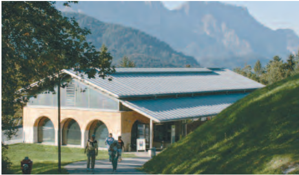
Gebäude der Dokumentation Obersalzberg