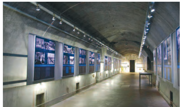
Die Winterausstellung im Bunker der Dokumentation Obersalzberg

Die 4. Winterausstellung »Von der Sachsenburg nach Sachsenhausen. Bilder aus dem Album eines KZ-Kommandanten«, wurde bis zum 11. April gezeigt und stieß auf lebhaftes Interesse bei den Besuchern. Die 5. Winterausstellung »Im Objektiv des Feindes. Die deutschen Bildberichterstatter im besetzten Warschau 1939–1945« lief am 22. Oktober an und wird bis zum 1. Mai 2011 zu sehen sein, der Begleitband ist in der Dokumentation Obersalzberg erhältlich. Erstmals wird für die Winterausstellung ein pädagogisches Begleitprogramm angeboten. Dazu gehören eine Führung durch die Winterausstellung und ein anschließender Workshop zum Alltag im Warschauer Ghetto anhand historischer Fotografien und Augenzeugenberichte.