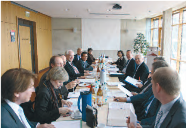
Stiftungsratssitzung am 16. April in der Dokumentation Obersalzberg