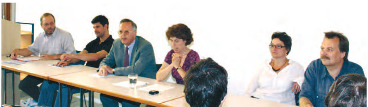
Betriebsversammlung am 20. Juli