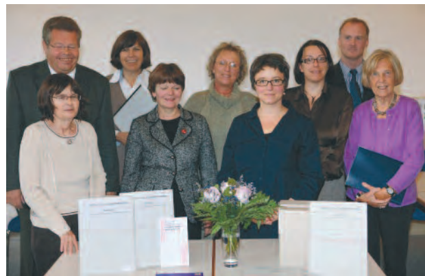
Übergabe der Findbücher zur Frauenbewegung

Die Verzeichnung des umfangreichen Zeitungsbestandes, der viele Titel aus der NS-Zeit enthält und seit 2008 sukzessive in der Zeitschriftendatenbank nachgewiesen wird, wurde weiter fortgeführt. Insgesamt sind mit dem Jahr 2010 aus dem Bereich Druckschriften und Zeitungen ca. 8.800 Medieneinheiten (Bücher, Periodika und Mikroformen) online nachgewiesen, darunter ca. 4.195 Zeitschriften und zeitschriftenartige Reihen.