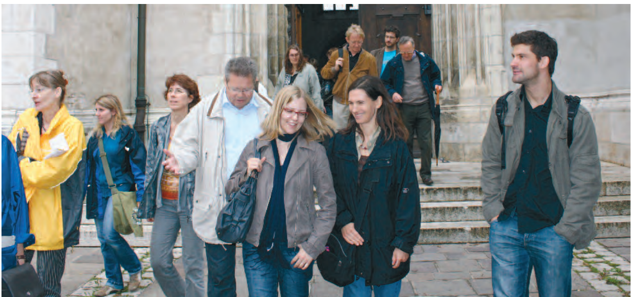
Betriebsausflug nach Ingolstadt