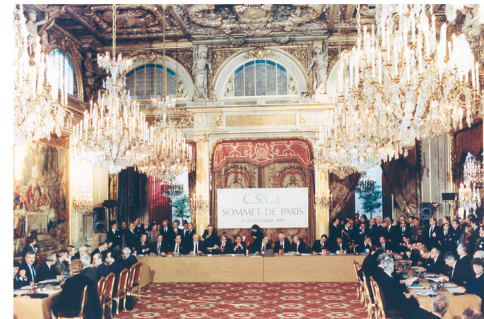
KSZE-Konferenz in Paris (1990)

Die Bedeutung des KSZE-Prozesses für das Ende des Ost-West-Konflikts 1989/92